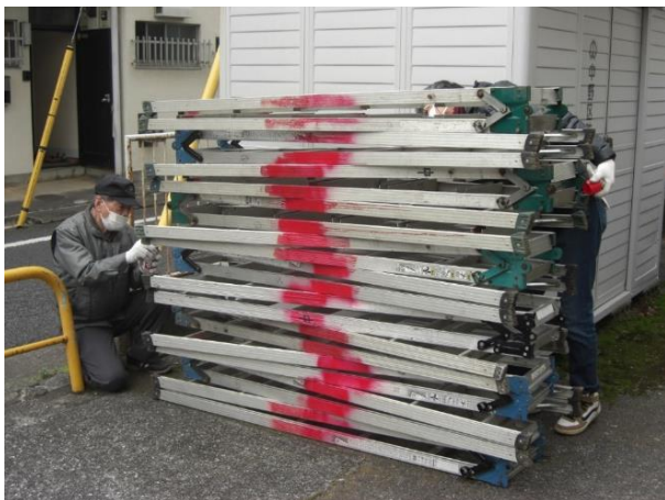
防錆潤滑スプレーで動きを調整しました。

今年も寒空の中、本部と江古田分室に分かれ、三脚やハシゴ等の点検・修理を行いました。